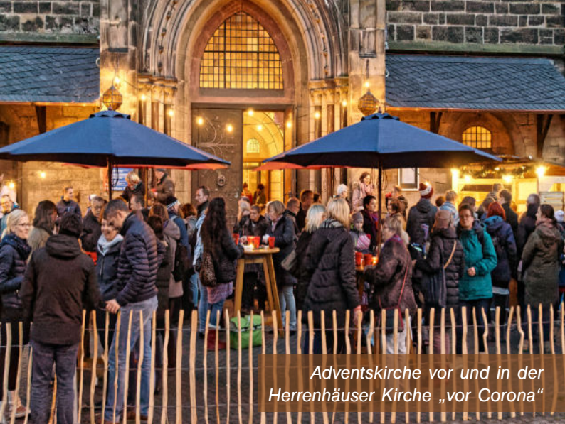
Adventskirche vor und in der Herrenhäuser Kirche „vor Corona“